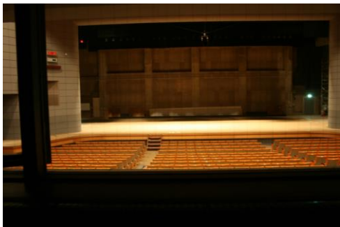
調光卓に着席して撮影