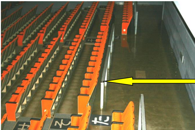
た列21番～32番は座席無し (車椅子スペース)